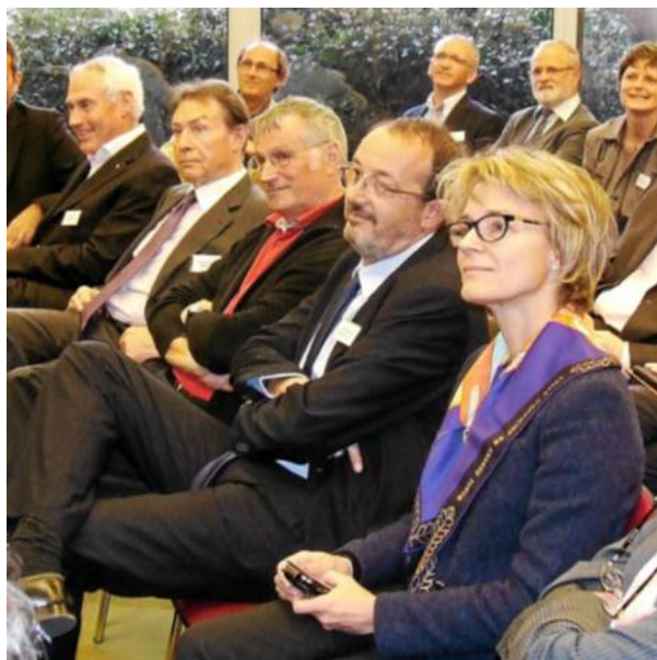
Le Mans Sarthe Investissements compte 21 investisseurs, soutenus par une banque et des cabinets d'expertise comptable et juridique.